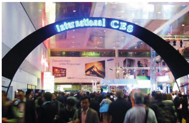
178 startups françaises ont fait le voyage à l'Eureka Park de Las Vegas. Elles représentent la deuxième délégation mondiale avec 32% des startups, juste derrière les Etats-Unis avec 203 startups

Le CES est un temps fort pour les startups de la French Tech. Il s'est imposé comme le salon mondial BtoB aujourd'hui incontournable pour toutes les entreprises et startups qui veulent lancer leurs produits, pénétrer le marché américain, rencontrer des distributeurs et investisseurs du monde entier, se faire repérer par les médias internationaux... Cette année, la France a représenté la 3e présence mondiale au CES avec 275 entreprises et structures exposantes, après les Etats-Unis avec 1 713 entreprises et la Chine 1307 entreprises. Parmi ces entreprises françaises exposantes, la grande majorité sont des startups. 233 ont été recensées, dont 178 rien que dans l'Eureka Park, l'espace