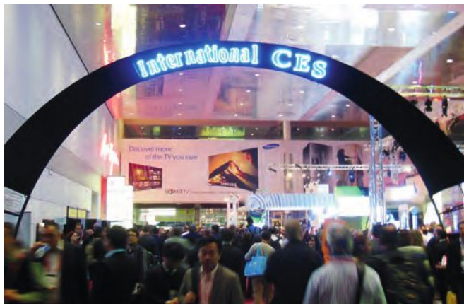
178 startups françaises ont fait le voyage à l'Eureka Park de Las Vegas. Elles représentent la deuxième délégation mondiale avec 32% des startups, juste derrière les Etats-Unis avec 203 startups

Le CES est un temps fort pour les startups de la French Tech. Il s'est imposé comme le salon mondial BtoB aujourd'hui incontournable pour toutes les entreprises et startups qui veulent lancer leurs produits, pénétrer le marché américain, rencontrer des distributeurs et investisseurs du monde entier, se faire repérer par les médias internationaux... Cette année, la France a représenté la 3e présence mondiale au CES avec 275 entreprises et structures exposantes, après les Etats-Unis avec 1 713 entreprises et la Chine 1307 entreprises. Parmi ces entreprises françaises exposantes, la grande majorité sont des startups. 233 ont été recensées, dont 178 rien que dans l'Eureka Park, l'espace